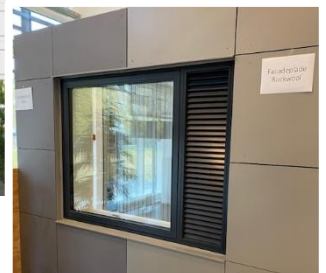
Udstilling af de nye vinduer