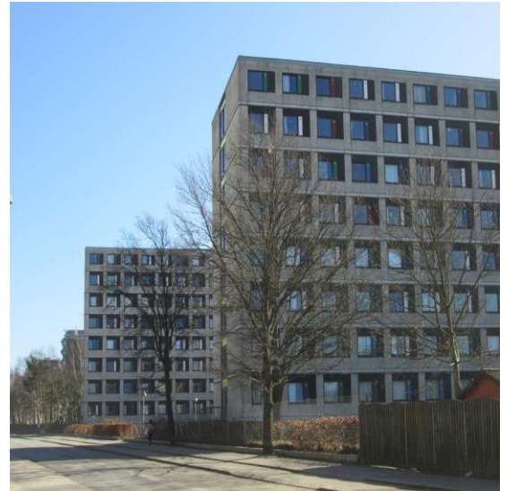
Facaderne nu. I marts 2022 vil blokkene fremstå mere ensartede.

De oprindelige vinduer blev udskiftet i 1990'erne, men trænger nu igen til udskiftning. Samtidig er isoleringen i ydervæggene ikke tilstrækkelig. Derfor starter den store facaderenovering og vinduesudskiftningen til september.